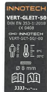
Etiqueta del producto con nombre del producto, norma, número CE, número de lote

cumple con las disposiciones del Reglamento 2016/425 y las normas DIN EN 353-1:2018 y EN 365:2004 , y que fue objeto del examen de tipo con el n.º de examen (de tipo): 2097-2011-PSA20-072-Z , ejecutada por la oficina de verificación de: