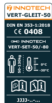
Etiqueta del producto con nombre del producto, norma, número CE, número de lote

cumple con las disposiciones del Reglamento 2016/425 y las normas DIN EN 353-1:2018 y EN 365:2004 , y que fue objeto del examen de tipo con el n.º de examen (de tipo): 2993-2511-PSA25-136-Z , ejecutada por la oficina de verificación de: