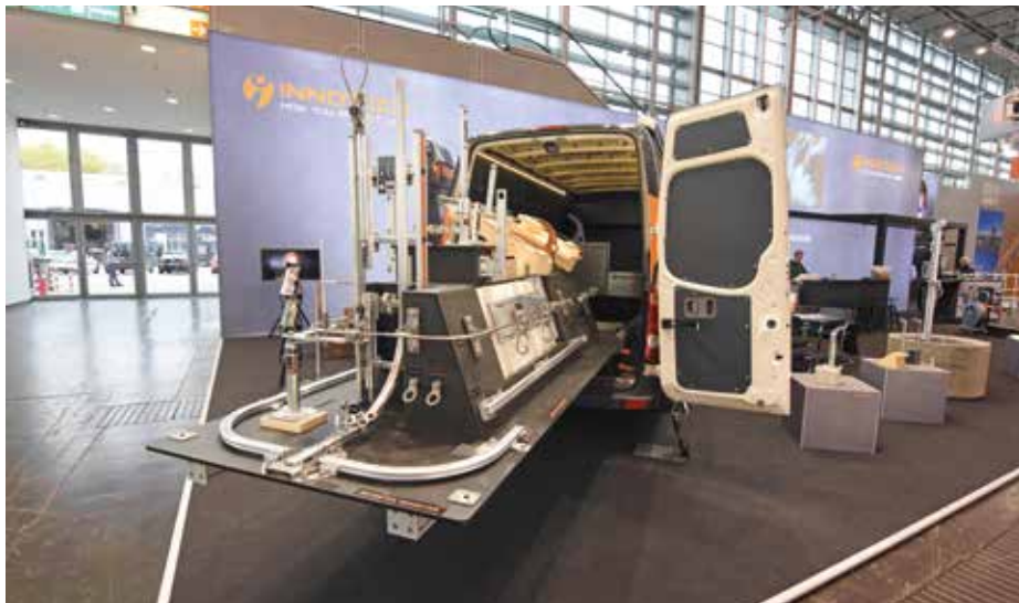
INNOTECH® bietet Ihnen mit einem mit allen Raffinessen ausgestatteten Schulungsbus eine mobile, aber zeitgleich kompakte Vor-Ort-Schulung.

Neuigkeiten gibt es bei der Lichtkuppelsicherung LIGHT. Die neue Rauch-Wärmeabzugsanlage (RWA) umgeht durch die geteilte Version gekonnt Hindernisse wie Zylinder und passt sich perfekt in der Breite